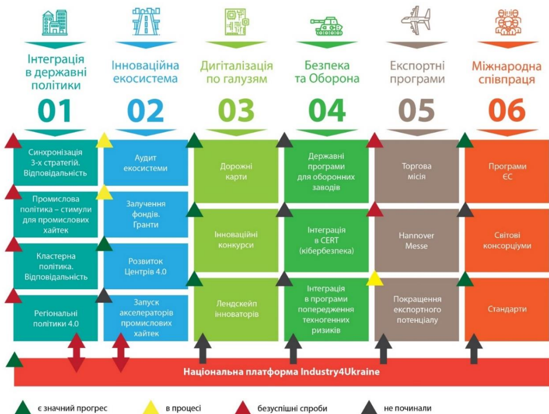
Рис. 1. Портфель проектів Індустрії 4.0 на кінець 2019 р.

В 2019-20 роках поступово розгортаються проекти по створенню в Україні Центрів експертизи 4.0, гармонізації технічних стандартів, створена платформа Industry4Ukraine, розпочинаються обміни на міжнародному рівні, розроблені перші програмні документи по цифровій трансформації окремих галузей тощо – рис. 1.